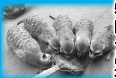
▲愛くるしい動きが人気のミニアキアット

日4月14日(土)～22日(日) 午前9時30分～午後4時30分 (16日(月)は休園)