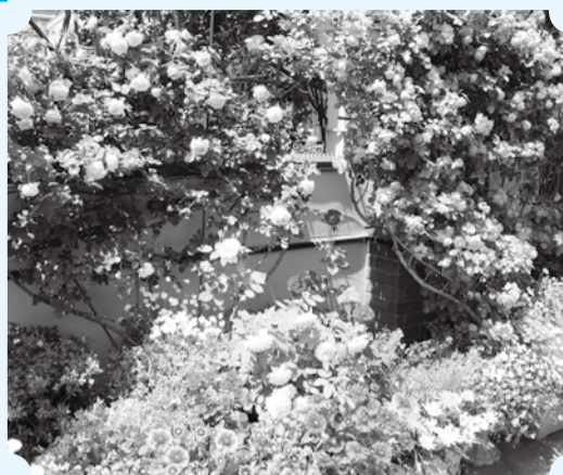
▲5月はバラが咲き誇る庭を楽しめます