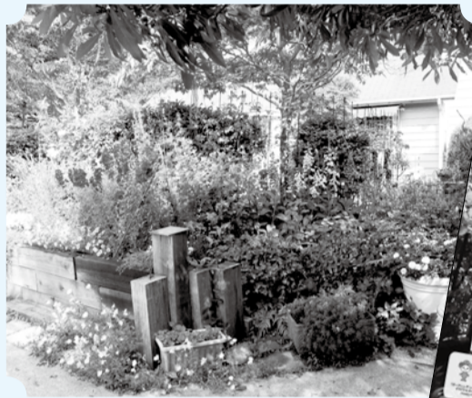
▲色とりどりの花が私たちを迎えてくれます

市民の方が丹精込めて作った庭や花壇を期間限定で公開するオープンガーデンを開催します。今回は、4月と5月合わせて過去最多となる67カ所を実施。詳しくはパンフレットや市公式Webサイトをご覧ください。