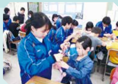
▲義務教育学校塩浜学園の前期課程・後期課程の交流の様子

3,290万円 平成32年度からの小学校での外国語の教科化に先立ち、3年生以上を対象に外国語活動指導員を派遣し、外国語教育の推進を図ります。