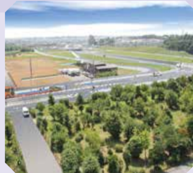
▲都市計画道路3・4・12号イメージ図

1,900万円 隣接する堀之内貝塚公園との連携強化を図るため、小塚山公園の拡充整備に伴う実施設計を行います。