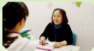
▲母子保健相談窓口「アイティ」

1,854万円 相談窓口において、母子健康手帳交付時の面接やプラン作成などを通じて、妊娠期から子育て期にわたる継続的な支援を行います。