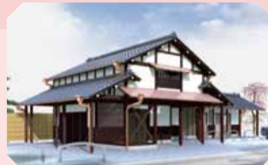
▲旧浅子神輿店前の広場イメージ図

1,310万円 東京2020オリンピック・パラリンピック開催を契機として、各種スポーツ競技のキャンプ誘致などを含めた関連事業を進めます。