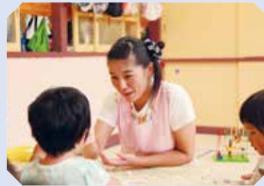
▲公立保育園の様子

3,000万円 子育て世帯とその祖父母世帯が同居または近居をスタートするための住宅購入などに対し、その費用の一部を助成します。