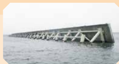
▲市川漁港に設置された防波堤

324万円 就労していない若者などへの支援として、相談、職場体験及び就職面接会を行います。