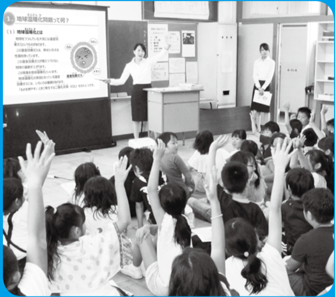
環境問題について学ぶ子どもたち

広報いちかわは新聞折り込みでお届けする他、市内各駅の広報スタンドと公共施設で配布しています。入手困難な方で自宅への配布をご希望の場合は、広報広聴課へお問い合わせください。