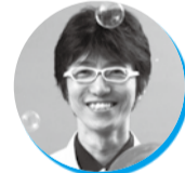
らんま先生 (環境パフォーマー)