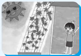
環境紙芝居「りゅうたくんと緑のカーテン」▲

公立保育園で、市オリジナルの環境紙芝居の読み聞かせをおこなっています。環境紙芝居は中央図書館でも借りることができます。