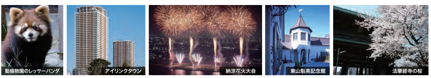
動植物園のレッサーパンダ

POINT 5 潜在保育士の職場復帰を支援 市川市では、保育士資格を持っていても実務経験がない又はブランクがある保育士に保育現場における実習の機会を提供して、保育施設へのスムーズな就職を支援しています。