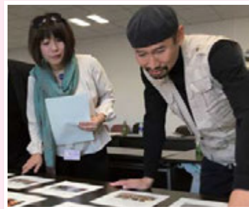
◀ 応募作品の審査の様子 (写真部門)