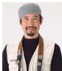
審査員 カメラマン 渡部陽一氏 ほか

例 家族の団らん、パパの育児、3世代同居家族の様子、親子で一緒に楽しみながら何かに取り組んでいる日常の様子 (食事作り、動植物の世話、楽器・スポーツの練習、語らいなど)、出産を控える家族で準備している様子等、子育て家族の絆やあたたかさ、ほほえましさを表しているもの