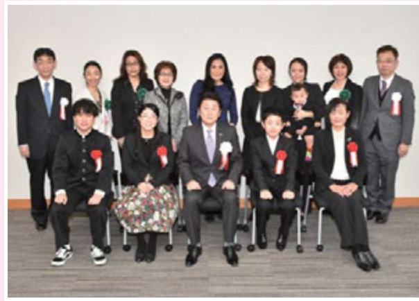
▲ 松山少子化担当大臣による表彰後の記念撮影