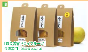
18 「ありの実ドライフルーツ」 与佐工門 (北區分2-6-10)