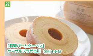
29 「和梨バームクーヘン」 ヤマザキブラザ市川 (市川1-9-2)