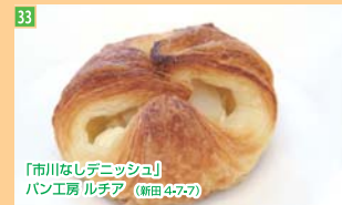
33 「市川なしゼニッシュ」 パン工房 ルチア (新田4-7-7)