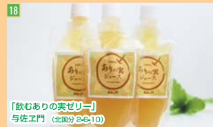
18 「飲むありの実ゼリー」 与佐工門 (北區分2-6-10)