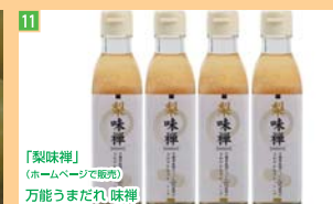
11 「梨味糖」 (ホームページで販売) 万能うまだれ味糖