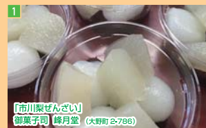
1 「市川梨せんざい」 御菓子司 峰月堂 (大野町 2-786)

市川市内の各商店が、市川の地域ブランドの「市川のなし」を使った商品を開発しました。バラエティ豊かな味をお楽しみください。 ※各店舗の番号は、広域地図の番号とリンクしています。