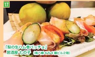
17 「梨の生ハム巻パッチョ」 居酒屋七の字 (南八幡4-3-4 藤ビル2階)