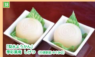
38 「梨氷ようかん」 季彩菓庵 しげつ (行徳駅前4-19-2)