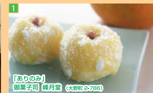
1 「ありのみ」 御菓子司 峰月堂 (大野町 2-786)