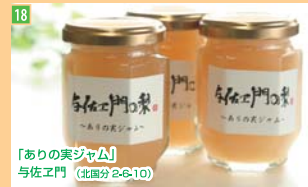
18 「ありの実ジャム」 与佐工門 (北區分2-6-10)