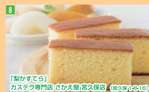
8 「梨がすてら」 カステラ専門店 さかえ屋 高久保店 (高久保 1-9-16)