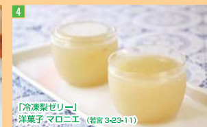
4 「冷凍梨ゼリー」 洋菓子 マロニエ (若宮 3-23-11)