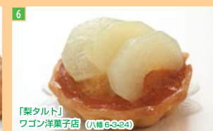
6 「梨タルト」 ワゴン洋菓子店 (八幡 6-3-24)