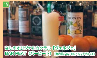
15 「なしのオリジナルカクテル」 「ヴェルジェ」 BAR PEAT (バーピート) (南八幡3-4-8 桜アパルメント2F)