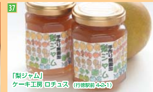
37 「梨ジャム」 ケーキ工房 ロチユス (行徳駅前4-2-1)