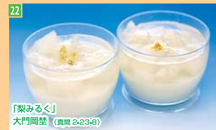
22 「梨みるく」 大門尚盛 (真間2-23-8)