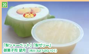
20 「梨シャーベット」 「梨ゼリー」 御泉子司 望月 (市川3-27-20-101)