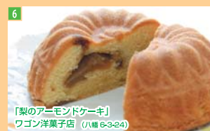
6 「梨のアーモンドケーキ」 ワゴン洋菓子店 (八幡 6-3-24)