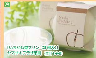
29 「いちかわ梨プリン(3個入)」 ヤマザキブラザ市川 (市川1-9-2)