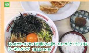
40 「おながりデザート市川製ジャム添え・キーマグ3ヶ+ライス付」 5〜6人タビコ (田2-21-18-18)