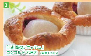
3 「市川梨のデニッシュ」 コンコルド 碧宮店 (若宮 2-3-5)