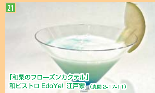
21 「和梨のフローズンカクテル」 和ピストロ EdoYa! 江戸家 (真間2-17-11)