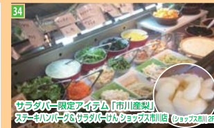
34 「サラダバー限定アイテム」 「市川産梨」 スターバックス&サラダバーにショップス市川店 (ショップス市川店)