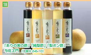
18 「ありの実の酢」 「純酢」 「梨酢」 与佐工門 (北區分2-6-10)