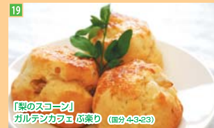
19 「ありの実スコージ」 カルデンカフェ ぶ楽D (區分4-3-23)