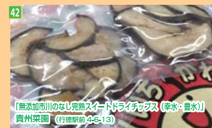
42 「無添加市川のなし完熟アイドドライアップス(砕氷・豊水)」 貴州菓園 (行徳駅前4-5-13)