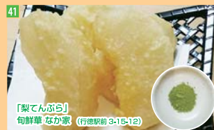
41 「梨てんぷら」 旬鮮華 なか家 (行徳駅前3-15-12)