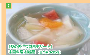
7 「梨の杏仁豆腐デザート」 中国料理 村越屋 (信久保 3-35-9)