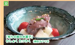
30 「有りの実の水菓子」 わしおんたのろく (新田5-7-13)