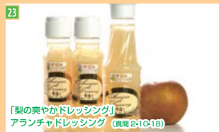
23 「梨の爽やかドレッシング」 アランチョドレッシング (真間2-10-18)