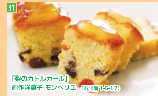
31 「梨のカタルカール」 創作洋菓子 モンペリエ (市川南1-5-17)