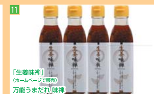
11 「生姜味糖」 (ホームページで販売) 万能うまだれ味糖