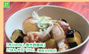
27 「市川のなし巻き酢豚丼」 ごはんやん(げん) (南區2-28-8)