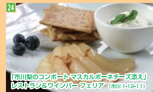
24 「市川梨のコンポート」 マスカルポーネチーズ添え」 「ビストラン&ワイパーフェリア」 (市川1-12-11)