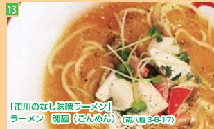
13 「市川のなし味噌ラーメン」 ラーメン 魂麺(ごんめん) (南八幡3-6-17)