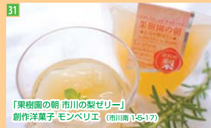
31 「果樹園の朝 市川の梨ゼリー」 創作洋菓子 モンペリエ (市川南1-5-17)