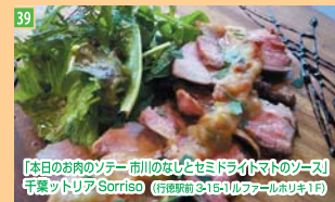
39 「本日のお肉ソテー 市川のなしとせとドライトマトのソース」 千葉ットリア Sorriso (行徳駅前3-15-1 ルヴァールホリキ1F)