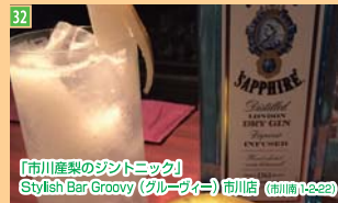
32 「市川産梨のジントニック」 Stylish Bar Groovy (グルーヴアー)市川店 (市川南1-23-2)