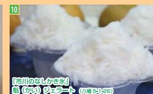
10 「市川のなしがき水」 魁(かい) シェラード (八幡 3-12-6)