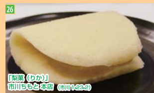
26 「梨菓(わか)」 市川ちもと本店 (市川1-23-2)