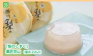
35 「梨のしずく」 菓匠京山 (福浜2-5-3)