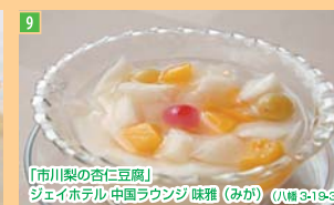
9 「市川梨の杏仁豆腐」 シェイホテル 中国ラウンジ 味雅 (みか) (八幡 3-13-3)