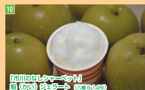
10 「市川のなしシャーベット」 魁(かい) シェラード (八幡 3-12-6)