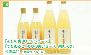
18 「ありの実100%ジュース」 「すやおろし ありの実ジュース 果肉入り」 与佐工門 (北區分2-6-10)