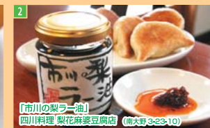
2 「市川の梨ラー油」 四川料理 梨花麻婆豆腐店 (大野町 3-23-10)