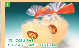
5 「市川の梨ゼリー」 パティスリーいわき (北方 2-12-2)