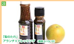
23 「梨のたれ」 アランチョドレッシング (真間2-10-18)