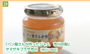
29 「パン屋さんが作ったジャム 市川の梨」 ヤマザキブラザ市川 (市川1-9-2)