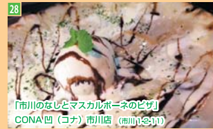
28 「市川のなしとマスカルポーネのピザ」 CONA 凹(コナ)市川店 (市川1-23-11)