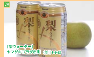
29 「梨ウォーター」 ヤマザキブラザ市川 (市川1-9-2)