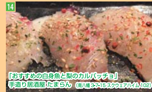
14 「おすすめの自身魚と梨のカルパッチョ」 手造り居酒屋 たまらん (南八幡3-7-15 スクエアビル102)