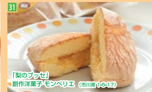
31 「梨のブッセ」 創作洋菓子 モンペリエ (市川南1-5-17)