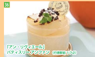
36 「アン・リヴィエール」 パティスリーアンファン (行徳駅前1-7-2)