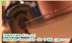
12 「和梨市川産のギムレット」 Stylish Bar Groovy(グルーヴアー)本店 (八幡2-14-16)