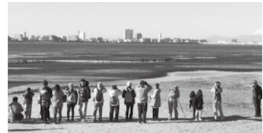
▲三番瀬の魅力を体感できます