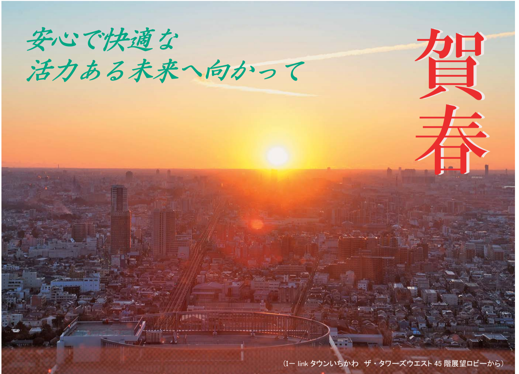
(I-link タウンいちかわ ザ・タワーズウエスト 45階展望ロビーから)