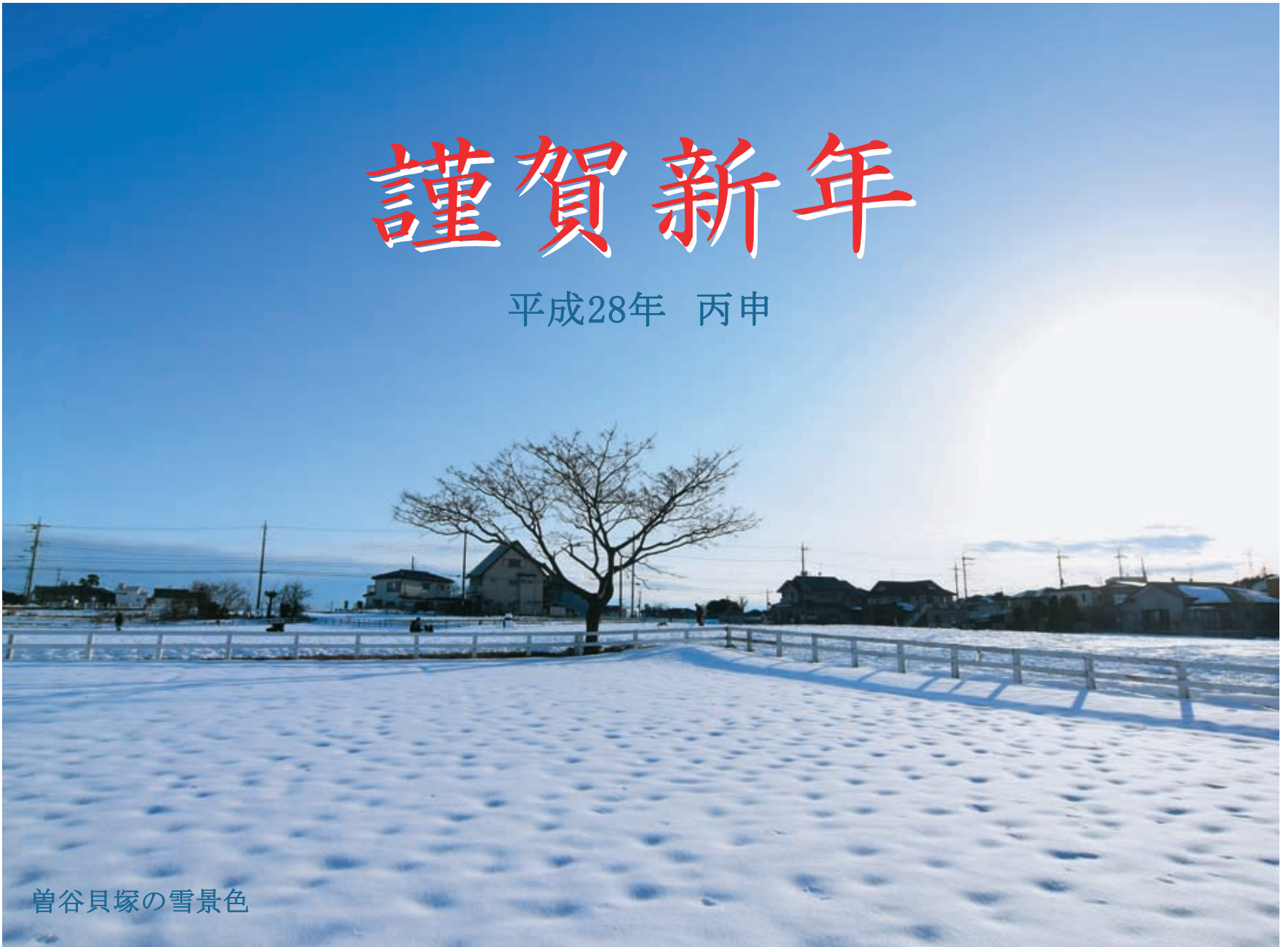
曾谷貝塚の雪景色