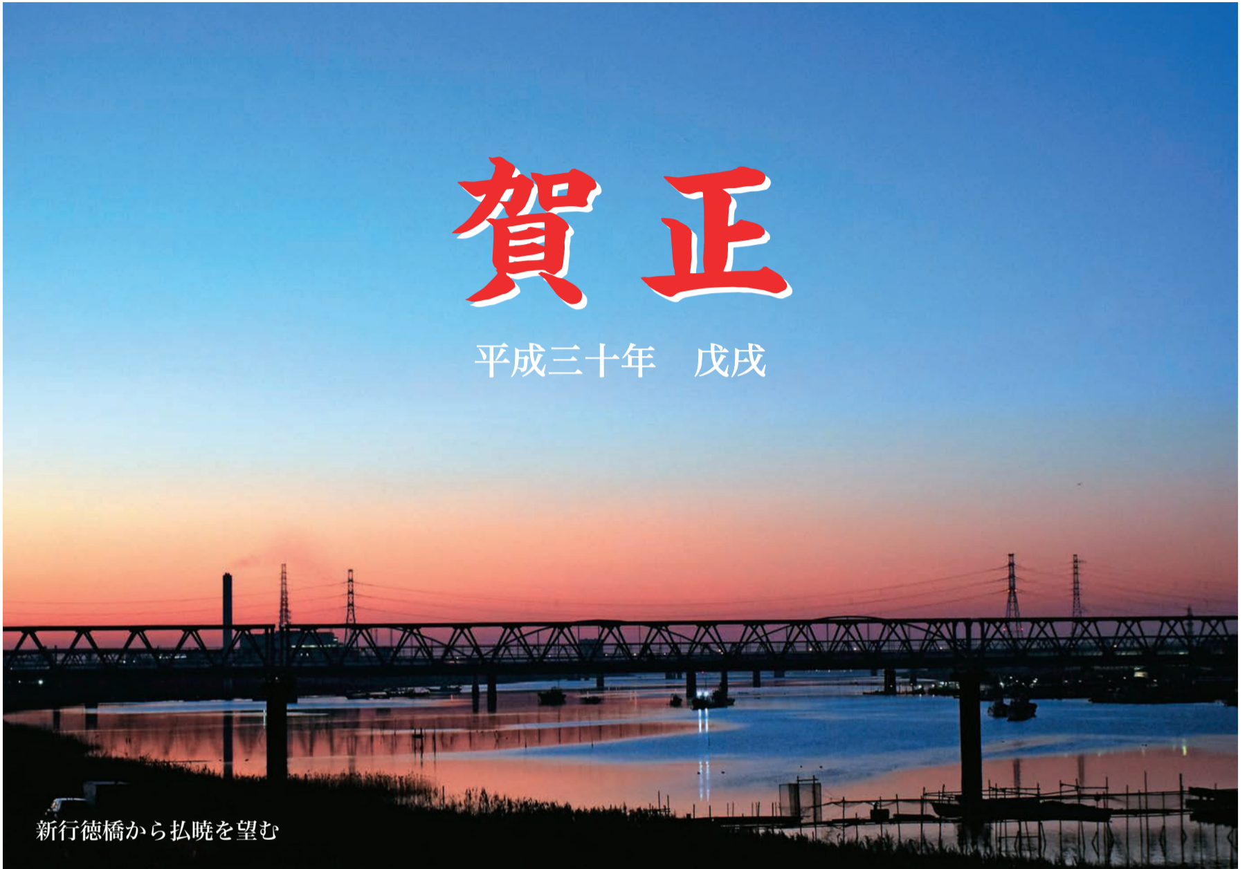
新行徳橋から払暁を望む