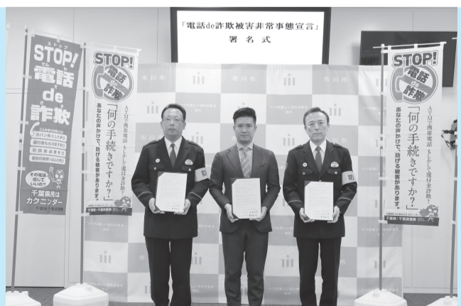
▲関係機関と連携して詐欺被害を食い止めます。

平成30年10月末現在、市川市内における電話de詐欺被害件数が県内ワースト3位という状況を受け、市と関係機関・団体が連携し、これ以上被害を拡大させないという強い決意を示しました。