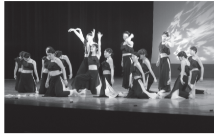
▲昭和学院のダンスパフォーマンス

場 文化会館 内 第1部/講演会「ホントに知りたい性のはなし ココロとカラダを大切にすって?」講師=染矢明日香氏(NPO法人ピルコン理事長)。第2部/レッドリボンダンス発表会。第3部/Aerstix sideスペシャルパフォーマンス 問 ☎712-8642保健医療課