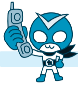
確認戦士 カクニンダー