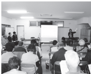
▲詐欺手口などについて 分かりやすく話します

また、電話de詐欺の手口について分かりやすく解説した映像を見ながら、被害の防ぎ方について考えます。