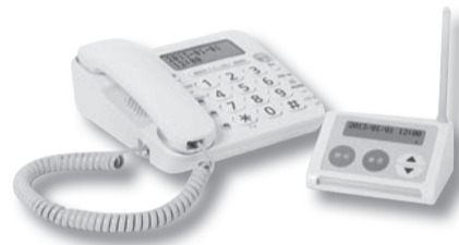
◀(左)通話録音機能付き電話 (右)迷惑電話防止機器

詐欺師と直接話さないことが、すぐにできる詐欺被害防止策です。 在宅中も留守番電話設定にすることで、留守番メッセージで電話の相手方を確認してから通話することができます。