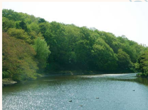
▲じゅん菜池緑地の斜面林

まで、林で集められる小枝や落ち葉、下草は火力を得るための大切な燃料でした。お風呂や台所で使うために、おもに冬、山仕事で集めておいたそうです。販売用に炭を焼いた地区もありましたが、自分たちの生活のために林を利用していた面が強かったようです。 人の手が入らなくなり、林は大きく姿を変えました。松が姿を消し、落葉樹の林から常緑樹の森へと変化しています。人の管理ではなく、自然界のルールに従うようになった結果です。都市化によって人のエリアと林とが近くなり、林が迷惑な存在になる場面もあります。新たな時代を迎えるいま、都市のみどりのあり方はむずかしい局面にあるようです。(自然博物館 金子謙一)