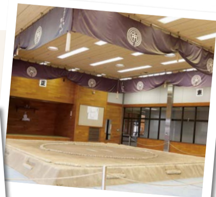
珍しい屋内の相撲場