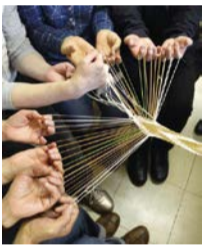
▲組紐古技法「クテ打」

組紐古技法「クテ打」を伝承し、来館者 に指導するボランティアを養成します。 日 ①ガイダンス②練習③実践など 日 ①2月24日(日)②3月10日(日)午後 1時30分~4時③3月24日(日)正午~ 午後2時30分 場 歴史博物館、他 人 申込順10人 日 2月9日(土)までにWEB申込 問 ☎373-2202 考古博物館