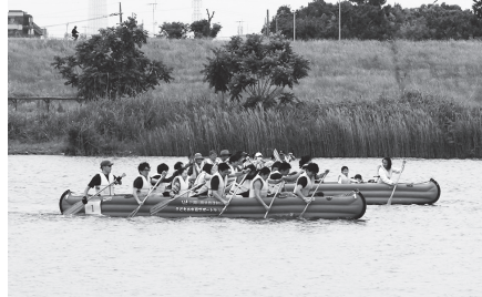
▲チームで力を合わせ、ゴールを目指します