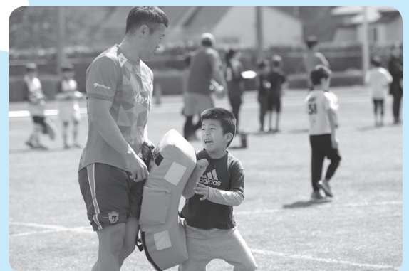
▲ラグビーの魅力を感じよう