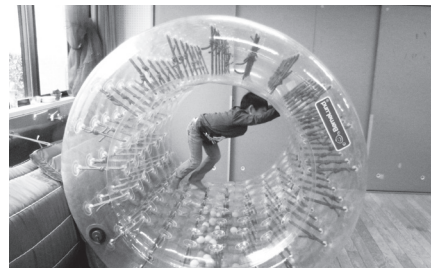
▲サイバーホイールなど楽しい玩具で遊ぼう