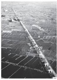
▲東西線高架橋建築の様子

千葉県における鉄道の開通から現在に至るまでの思い出の車両や駅、すでに歴史の彼方へと去ってしまった景色など、千葉県における鉄道のあゆみを写真で振り返ります。