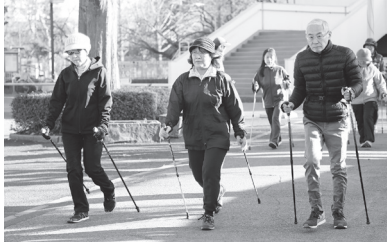
▶全身を使って行うノルディックウォーク

健康や体力づくりを目的とし、4~7月、8~11月、12~3月の3期制で行っています。4月からの教室の参加者を募集します。