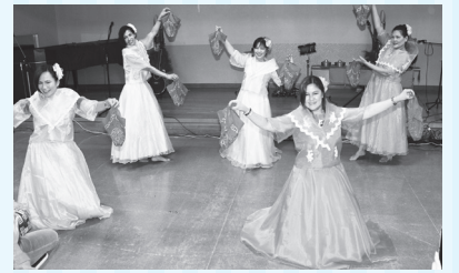
▲過去のイベントの様子

市内在住の外国籍の方々と交流する催し「国際村いichかわ」。「We are Ichikawan」というコンセプトで、国籍に関係なく一緒に楽しむ一日です。ステージでの各国の歌や踊りや世界の国々を紹介するブース、各国の珍しい料理が味わえる