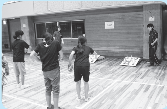
▲楽しく体を動かそう

日 3月9日(土)午前9時 30分～午後0時30分 場 塩浜市民体育館 物 運動のできる服装、 屋内用運動靴、タオル、 飲み物など