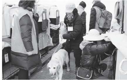
▲ペット同行避難訓練の様子

大規模災害時の避難所でのペット(犬及び猫)対応の手伝いやペットの適正な飼い方の啓発活動をするボランティアを募集します。