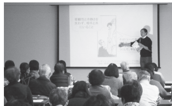
▲悩んでいる人の支えとなりませんか

ゲートキーパーとは、特別な資格ではなく、悩んでいる人に気づき、声をかけ、話を聞いて、必要な支援につなげ、見守る人のことです。今回の講座では、初心者向けにゲートキーパーの心得や傾聴の方法を講演とロールプレイ(体験学習)を通して伝えます。