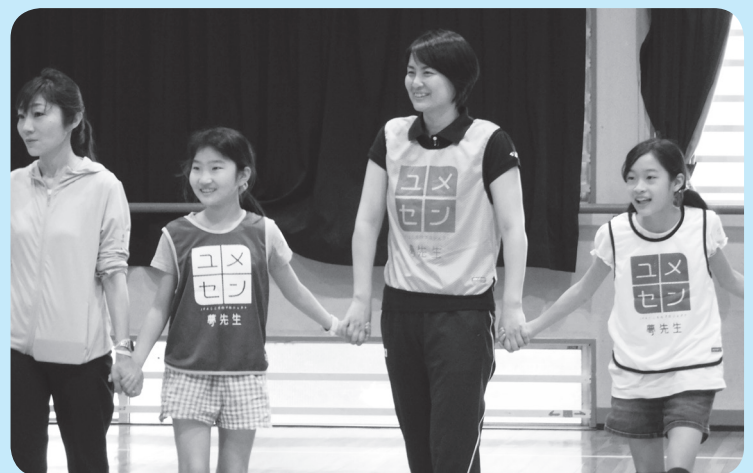
▲昨年5月に行った同教室の様子

申 WEB申込、または往復はがきに参加者全員の申し込み事項(3面上段参照)、小学生は学校名と学年を書き、3月7日(木)必着でスポーツ課(〒272-0827国府台1-6-4)