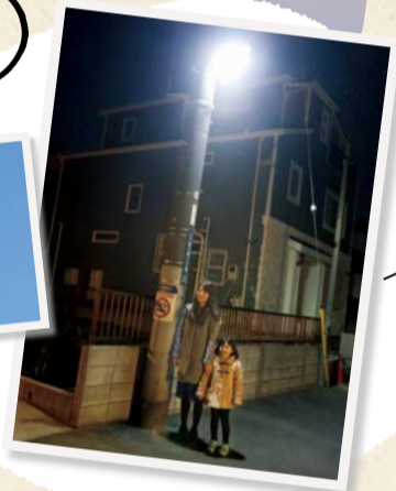
まちが明るいと 安心だね