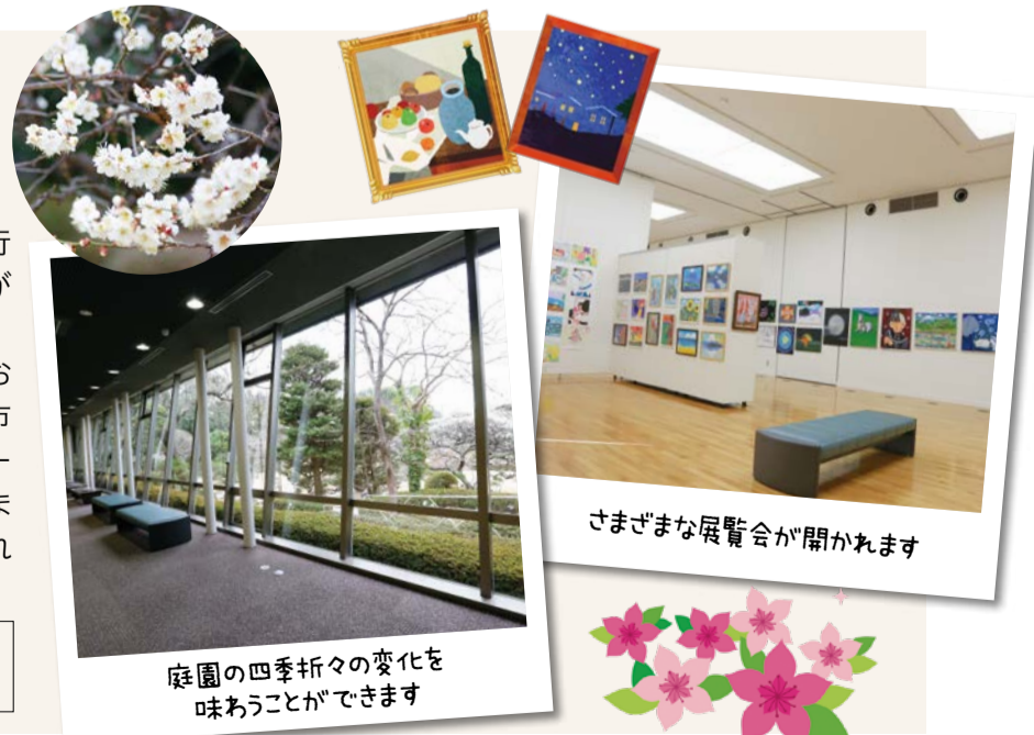
さまざまな展覧会が開かれます

場 真間5-1-18 開館時間 :午前9時～午後5時 休館日 :毎週月曜日(祝日の場合は開館、翌日休館) 問 ☎374-7687