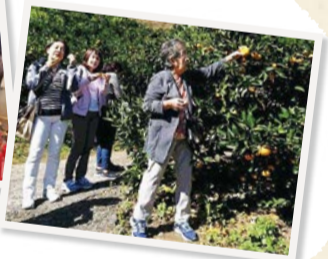
▲多くの方と仲良くなる 親睦会