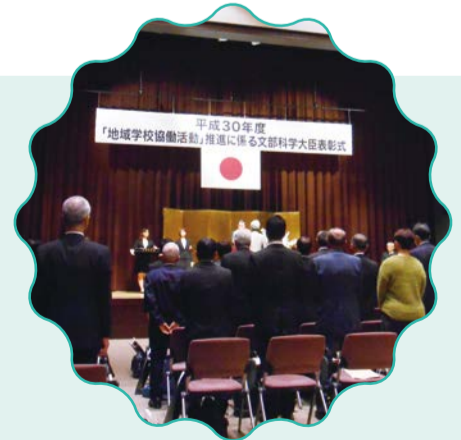
日頃の活動が評価され、「平成30年度『地域学校協働活動』推進に係る文部科学大臣表彰」を受賞しました。