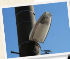
▲路地や生活道路を照らす防犯灯は自治会が管理・点検しています