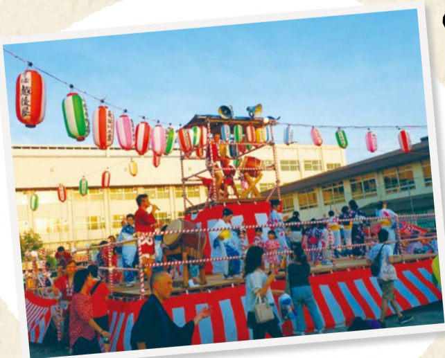
※秋祭りや文化祭などを行っている自治会もあります。