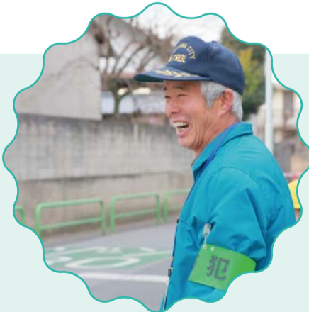
稲荷木小学校見守り隊による日々の安全指導の様子です。地域の目で、通学する子どもたちの安全を見守ります。