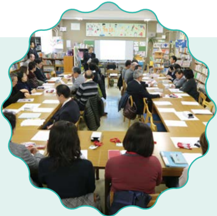
あいさつ運動のやり方は、3校合同の学校運営協議会で細かく話し合われました。