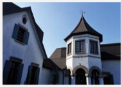
▲東山魁夷記念館で すてきなひとときを