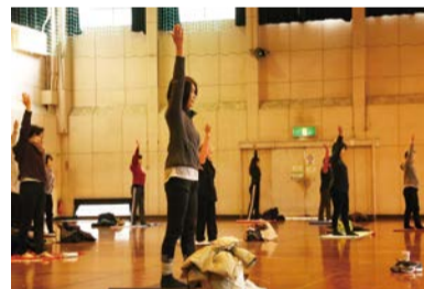
◀運動で心と体を健康に

料 1教室3,000円(15回分。事前一括納付) 回 往復はがきに申し込み事項(6面上段参照)、会場名、希望する教室を第3希望(複数教室申込可能ですが、はがき1枚につき当選は1教室)までを記載し、3月15日(金)必着で①ISG塩浜事務所(〒272-0127塩浜4-9-1)へ郵送、または ISG塩浜の窓口にある申請書に返信用はがきを添付して持参。②国府台市民体育館(〒272-0827国府台1-6-4)へ郵送、または信篤市民体育館の窓口にある申請書に返信用はがきを添付して持参。①②とも応募多数の場合は、3月19日(火)に抽選。 回 ① ☎395-1166同事務所 ② ☎373-3112スポーツ課