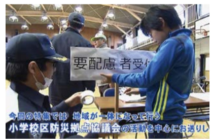
今回の特集では、地域が一体になって行う小学校区防災拠点協議会の活動を中心にお送りします。

大地震が発生しても、慌てず落ち着いて行動するための、普段からの備えについてお届けしました。詳しくは下記2次元コードから視聴できます。