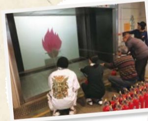
▲みんなで楽しく学ぶ 施設見学会