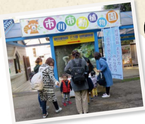
子どもを連れて 友だちの家族と動植物園へ