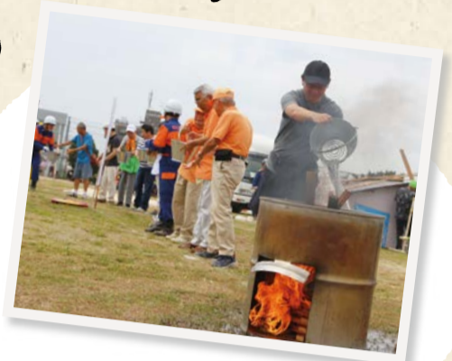
地域で力を合わせ いざというときの備えを確認