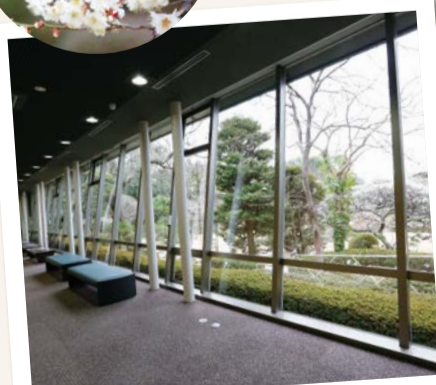
庭園の四季折々の変化を 味わうことができます