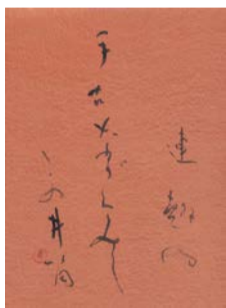
▲土橋靖子書「連翹・れんぎょう」 水原秋櫻子「連翹や手古奈がくみしこの井筒」

場 芳澤ガーデンギャラリー 料 一般300円、65歳以上240円、団体(25人以上)240円、中学生以下無料、障害者手帳をお持ちの方と付添の方1人無料 問 ☎300-8020文化振興課