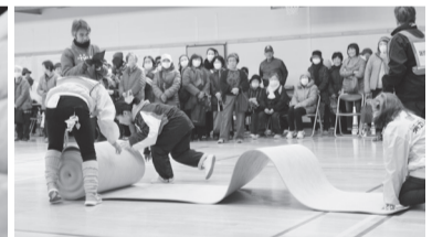
▲避難所マットの設置