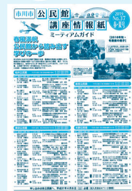
▲公民館講座情報紙

アートや料理、ヨガ、子ども向け講座など、大人も子どもも楽しく学べる多彩な講座を市内16カ所の公民館で行います。詳しくは3月22日(金)発行の「公民館講座情報紙(ミーティアムガイド)」または市公式Webサイトをご覧ください。