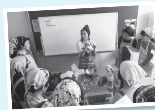
▶昨年実施「麺の使い方教室」(信篤公民館)