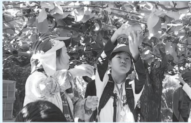
▲市内梨園での梨狩り体験の様子(昨年10月)

子どもたちが環境に関心を持ち行動できるように、自然観察会や施設見学会などを通じて学びながら、環境にやさしい活動に取り組みます。生き物や草花が好き、環境問題に興味がある人、家族やグループで地球に良いことを始めましょう。会員には本クラブ主催の楽しい体験イベント情報などをお知らせします。