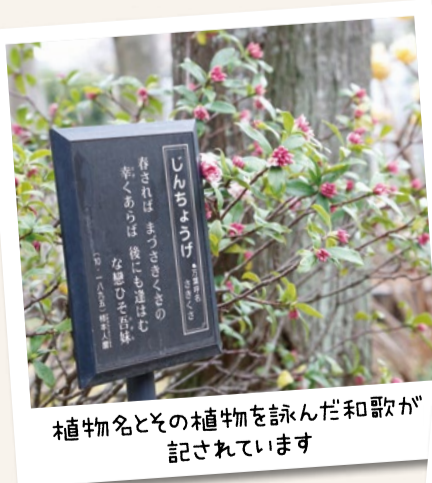
植物名とその植物を詠んだ和歌が記されています