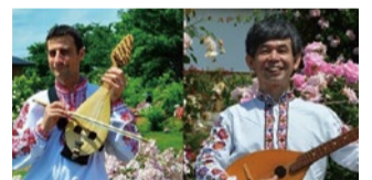
▲ブルガリア通の方々が案内・演奏します

日 5月2日(休)午後2時(開場は30分前) 場 文化会館 内 ブルガリアについての講演・コンサート、民族楽器・民族衣装の展示、民族楽器体験、フォークダンス体験 人 申込順420人(5歳未満入場不可) 申 ☎379-5111文化会館 (文化振興課)