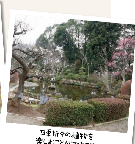
四季折々の植物を楽しむことができます