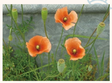
▲ナガミヒナゲシの花

因と言われたこともありすっかり悪者にされてしまいました。花粉症の話は誤り、というのはすでに定説ですが、いまでも否定的な印象がぬぐえずにいる人も多いようです。市川市域では街が成熟して空き地自体が減ったため、大群落をつくる場所がそもそも無くなりました。アスファルトの隙間からでも生えることのできるナガミヒナゲシだからこそ、平成の時代に勢力を広げられたとも言えるでしょう。