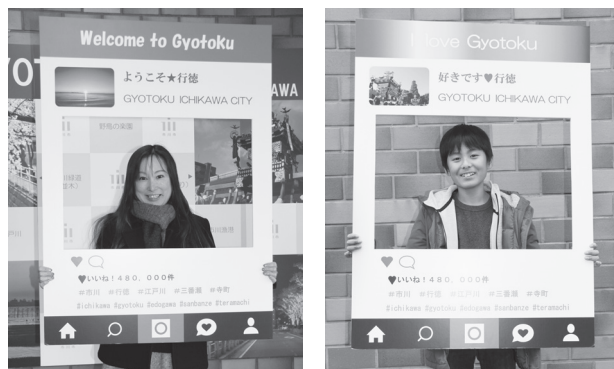
♥好きなフレームを選んで撮影できます(全4種類)