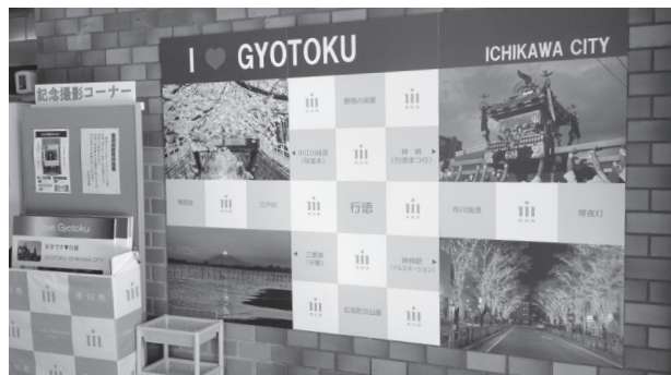
♥行徳の魅力とともに記念撮影