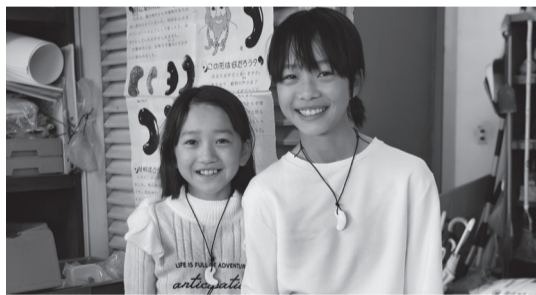
▲現代でも輝くアクセサリー