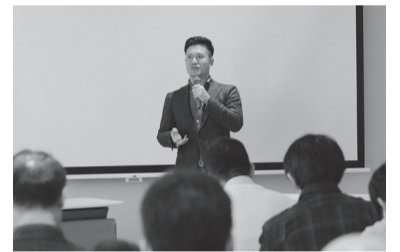
▲過去のタウンミーティングの様子

市川の魅力について、地域で活躍している方をゲストに招き、市長との対談を通して紹介します。対談は参加者のみなさんからの意見・質問を取り入れながら進行します。