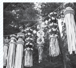
▲七夕飾りがお出迎え