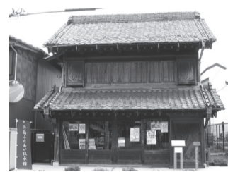
行徳ふれあい伝承館の整備