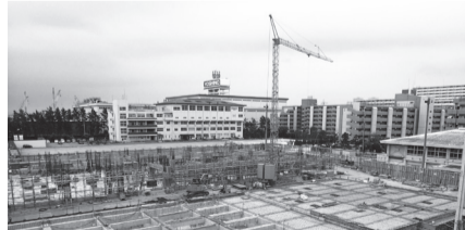
塩浜学園の校舎及び屋内運動場の新築工事