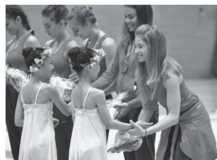
ブルガリア新体操チームとの交流