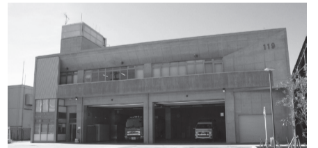
東消防署高谷出張所の建て替え工事