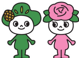
「ガーデニングシティいちかわ」 オリジナルキャラクター クロロとバララ