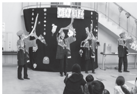
▲伝統芸能南京玉すだれ