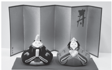
▲自分だけのオリジナル雛人形を作りませんか