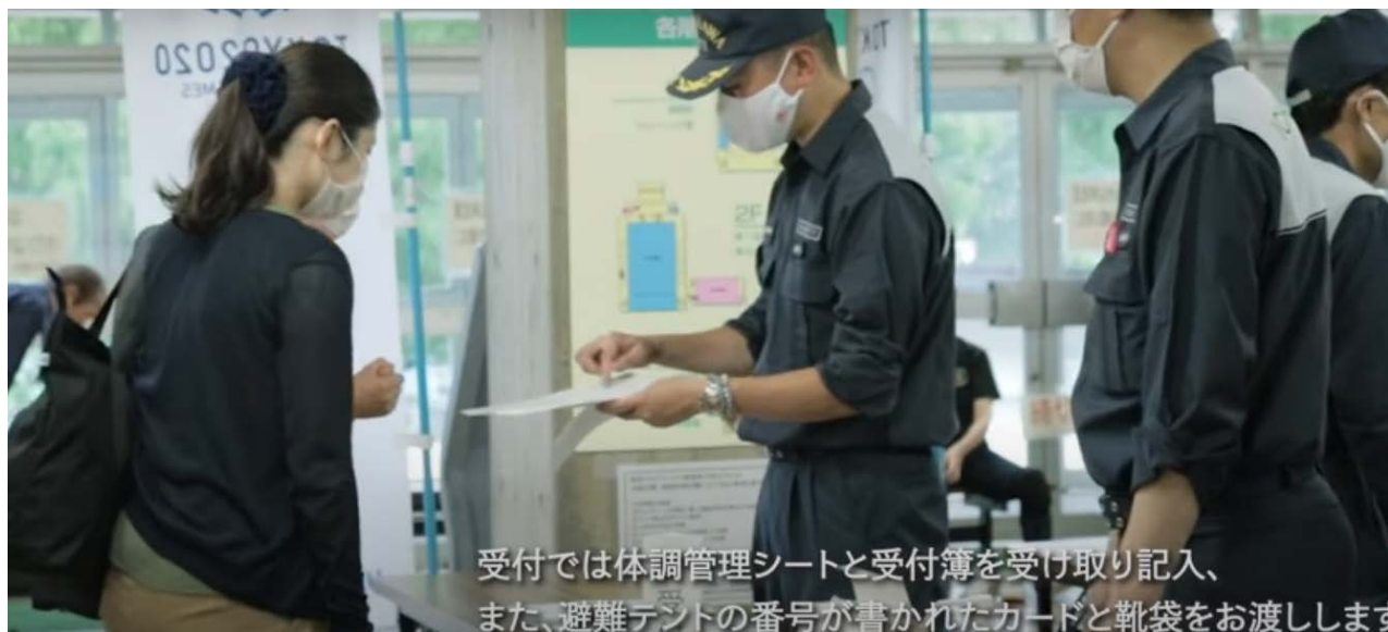
受付では体調管理シートと受付簿を受け取り記入、 また、避難テントの番号が書かれたカードと靴袋をお渡します