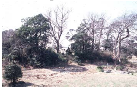
(市川市 考古博物館資料)