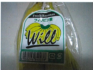
品物にはられたシール