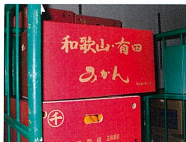
品物が入っているはこ