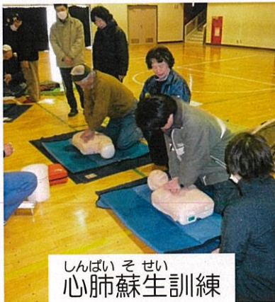
しんばいそせい 心肺蘇生訓練