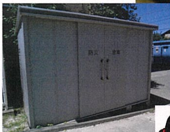
学校にある防災倉庫