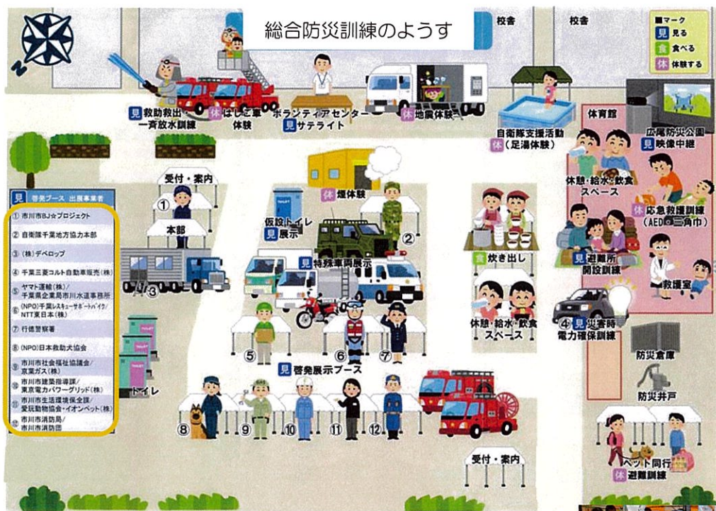
出典 (令和元年度 市川市総合防災訓練リーフレット)

たくやくんたちは、市川市の取り組みを調べるために、市の総合防災訓練に参加しました。