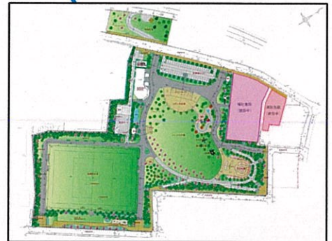
ひろお 広尾防災公園