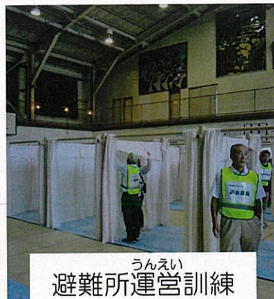
うんえい 避難所運営訓練