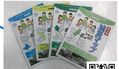
げんさい 市川減災マップ