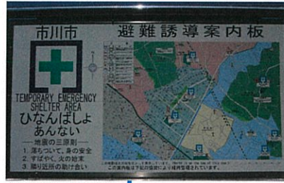
ひなんゆうどうあんないばん 避難誘導案内板