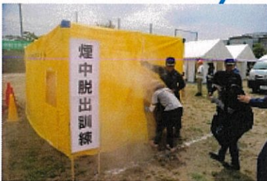
くんれん けつり 防災訓練 (煙訓練)