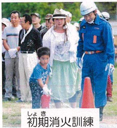
しよき 初期消火訓練