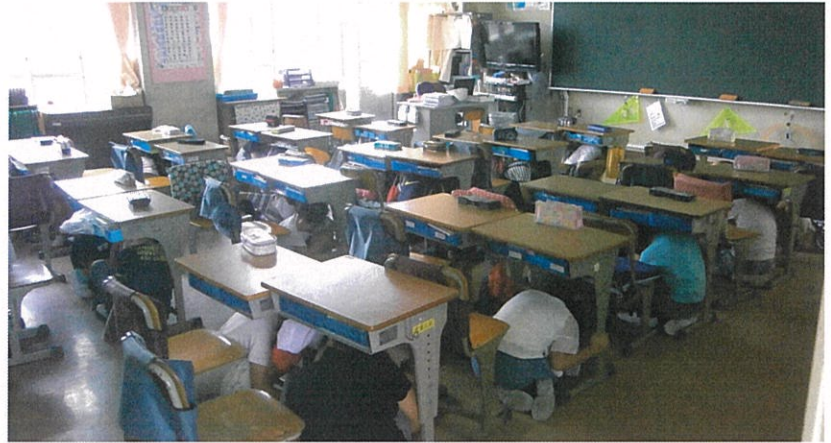
避難訓練のようす