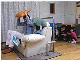
西部防災センター

日ごろからできることがたくさんあるね。安全を守るための行動や、 自然災害への備えを考えていきたいね。