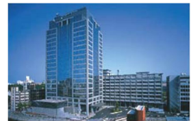
千葉県ちよう