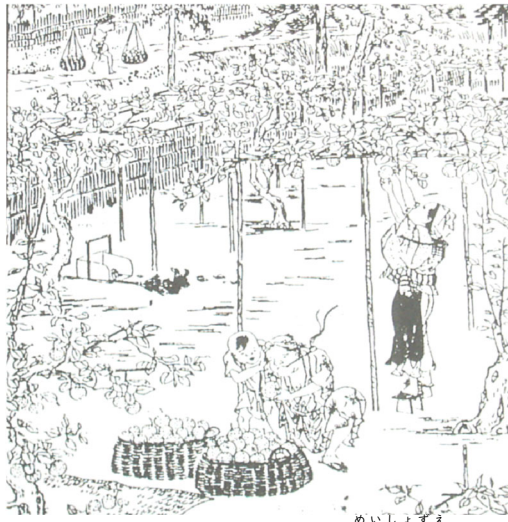
梨の取り入れのようす (江戸名所図会)