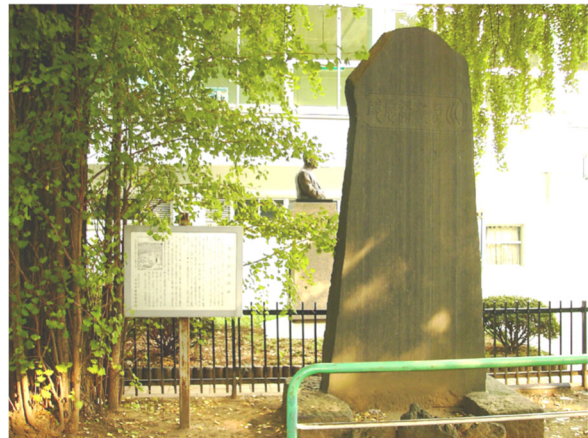
川上善六の記念碑 (八幡 葛飾八幡宮)