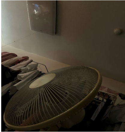
ペンネーム：ういろう子

扇風機の電気代はエアコンの約1/10ととても省エネです。また、エアコンと併用することによって設定温度を1~2°C上げて涼しく過ごせることにつながります。