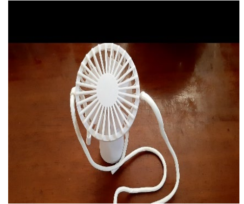
ペンネーム：ぱるるん

エアコンを30°Cに設定して扇風機を使いました。節電しながらつらいこともなく過ごせました。