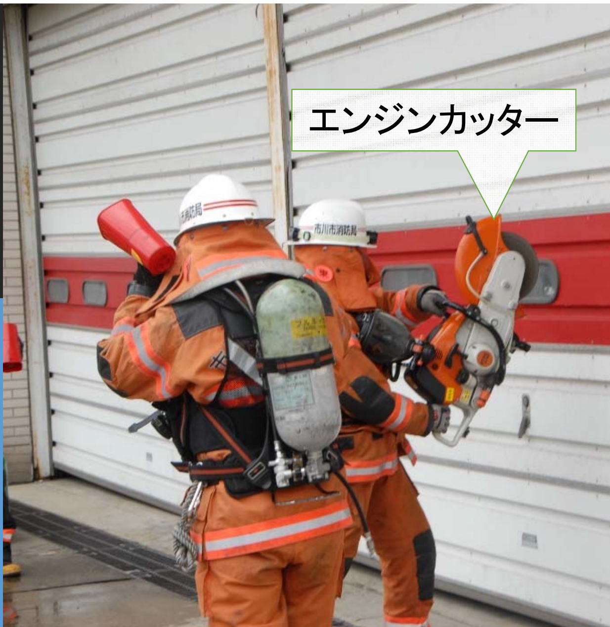
エンジンカッター