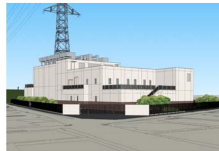
完成予想図（産業道路側正面入口より）