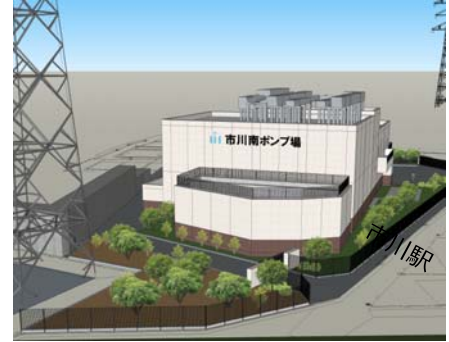
完成予想図（江戸川堤防より）