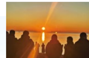
▲塩浜三番瀬公園から見た初日の出