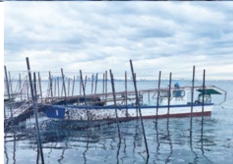
▲三番瀬はノリ漁も盛んです