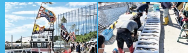
▲漁港に並ぶ大漁旗

今年も10月に開催を予定しており、みなさんに楽しんでいただけるようイベントの規模を拡大して準備を進めています。