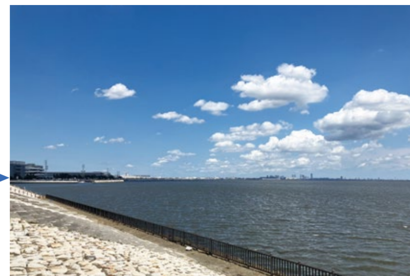
▲緩傾斜・階段護岸(令和3年10月完成)