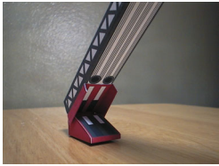
「はしご部」完成写真