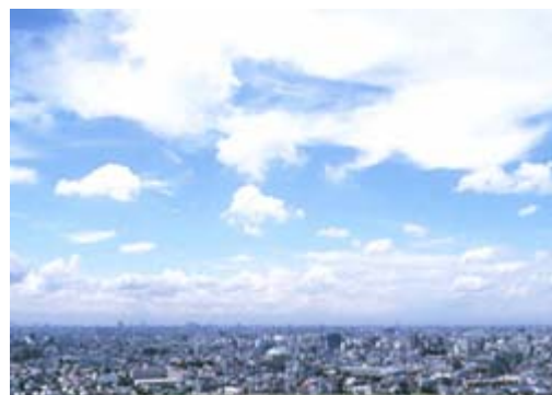
市川駅周辺の眺望

快適に安心して歩いて暮らせる街づくりを目指し、歩道のバリアフリー化や十分な歩行者空間の確保、高齢者対応のエレベータの設置、また公共の駐輪場を整備します。