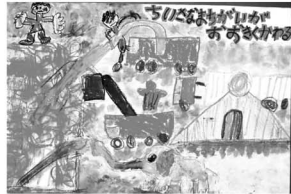
平成20年度最優秀賞作品(2作品)