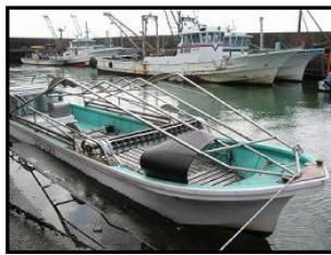
さいしゆせん のり採取船 (のりあみの下に もぐつてのりをつむ)