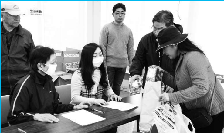
▲大洲防災公園での支援物資受け付け

東日本大震災により、お亡くなりになられた方々のご冥福をお祈りいたしますとともに、被災された皆さんには心からお見舞い申し上げます。