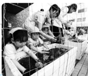
▲行徳支所でゴーヤの苗植えをする保育園児たち

ゴーヤなどのつる植物を植えると成長して日陰をつくり、日差しを遮る効果が生れます。また、植物は根から吸った水分を常に蒸発させているので、そこを通る風は涼しく感じられます。