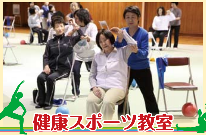
▲エアロビクス教室