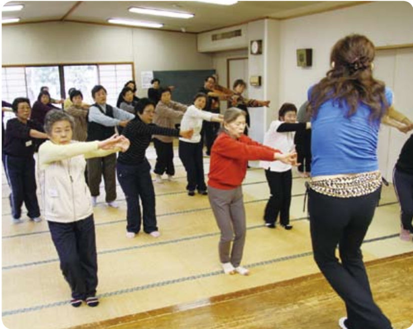
ほど良い運動でストレス解消にも効果(東部公民館)