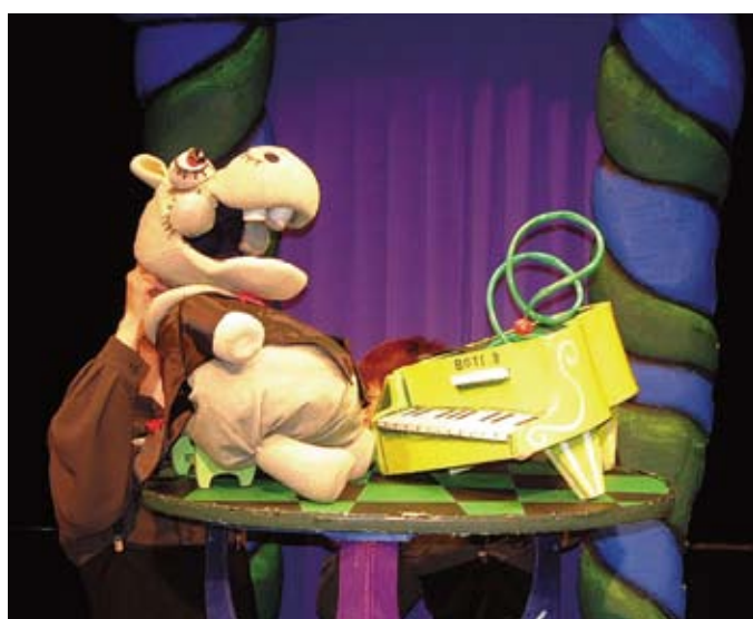
▲上演予定の「ぼちぼちいこか」の一コマ

子どもに人気の人形劇団 プークによる上演 日 2月19日(日)午後1時30分(開場は30分前) 場 メディアパーク市川2階グリーンスタジオ 人 幼児～小学校低学年、先着150人 問 ☎377-5933 杉の木保育園