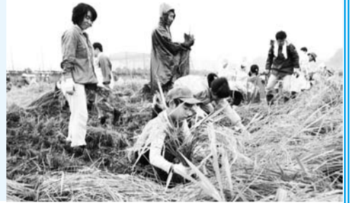
▲貴重な稲刈り体験に子どもも夢中

市内の自然豊かな田園風景の中で、田植えの準備から収穫までの作業を、親子で体験できます。