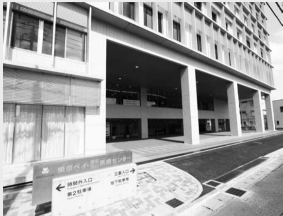
▲3月に完成した新病棟(地上8階地下1階、延床面積約28,000㎡、鉄筋コンクリート造り)

市川、浦安の両市が補助し、旧浦安市川市民病院の後継医療法人により進められていた、東京ベイ・浦安市川医療センターの建て替え工事が終了し、新病棟での診療が始まります。4月からは、これまで仮病棟で行っていた9診療科に、新たに9科を加えた18診療科、病床については、ICU、CCUを含む165床でスタートし、平成25年度末までに、20診療科、344床に拡充していく予定となっています。また、仮病棟は、災害時の医療活動などに使用できる緑地として整備される予定です。(保健医療課)