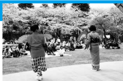
▲藤棚前のステージでの演技が桜まつりを盛り上げる

260本のソメイヨシノやオオシマザクラに彩られる「里見公園桜まつり」を開催。期間中は、北原白秋ゆかりの「紫烟草草」も一般公開します。4月7日からの土・日曜日の夜間は、園内の桜をライトアップしますので、幻想的な夜桜も楽しめます。