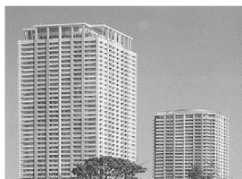
市川市アイ・リンクタウン展望施設