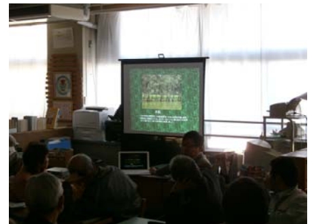
近江先生による講義の様子

今回から利用に関することの検討に入ってきました。市民の皆様にとって利用しやすい公園になるよう、会員の皆様には今後も引き続きご意見をよろしくお願いいたします。