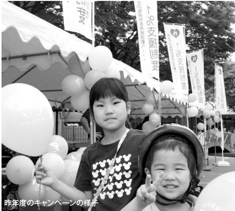
昨年度のキャンペーンの様子

広報いちかわは新聞折り込みでお届けするほか、市内各駅の広報スタンドと公共施設で配布しています。入手困難な方で自宅への配布をご希望の場合は、広報広聴課へお問い合わせください。