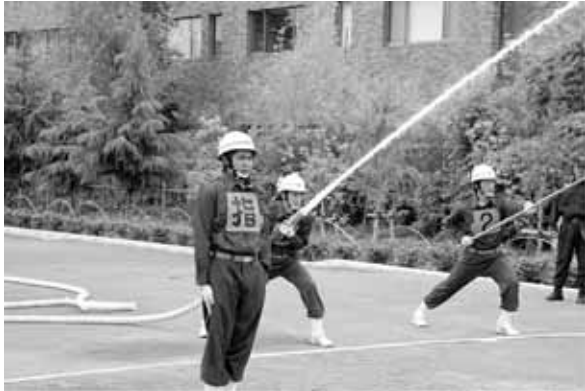
昨年の消防団消防操法大会の様子

市川市においても地域防災計画が大きく見直され、新たな被害想定も出されました。我々消防団は、市民の皆様の被害を少しでも軽減するため、日頃からの訓練はもとより、防火防犯活動など、地元根付いた活動を続け、住民の期待と信頼に応えるよう、各種イベント等における防火啓発活動等を行いながら、安全で安心な地域づくりに努めてまいります。どうか市民の皆様におかれましても、我々消防団の使命をご理解いただき、市民と消防