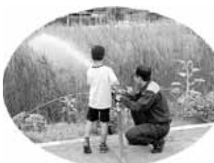
注目！！ こども消防士が放水中

を備えた緑豊かな消防署です。昨年もお子様から大人まで、大勢の人たちでにぎわいました。 ぜひこの機会に、消防署を見学しながら、夏休みの思い出や絵日記の1ページとして、ご家族みなさんで消防体験をしてみませんか？