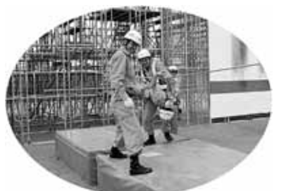
ちびっこ救助隊参上！

※会場には駐車場がありません。電車・バス・自転車等をご利用いただきご来場をお願いします。 また、雨天の場合は中止となりますので、開催当日は消防テレフォンガイドへ、その他ご不明な点は消防局、予防課へお問い合わせ下さい。