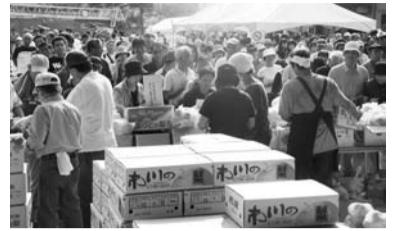
※敷地内工事中につき、車両でご来場の場合、入場制限を行うことがありますのでご了承ください。

野菜や果物、花き、乾物、食肉、鶏卵などの食料品や日用雑貨の販売を行います。また、模擬セリや屋台、ゲームなどの出店、各種イベントあり。