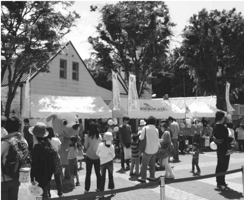
▲ 昨年の1%スタートフェスティバル

広報いちかわは新聞折り込みでお届けする他、市内各駅の広報スタンドと公共施設で配布しています。入手困難な方で自宅への配布をご希望の場合は、広報広聴課へお問い合わせください。