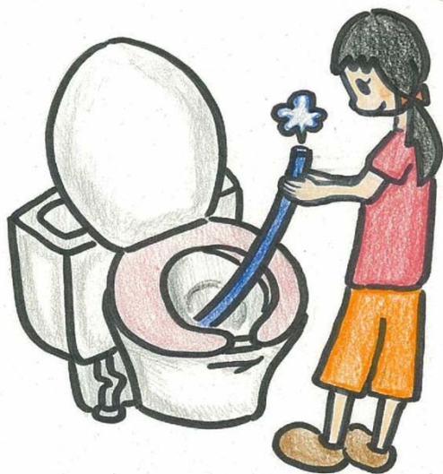
②便器内のエア抜きで圧力差を解消