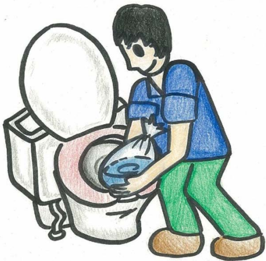
①簡易水のうでふさぐ

台風や局地的な豪雨の際に、トイレが流れづらい時があります。排水の逆流を防止するための代表的な方法をご紹介します。